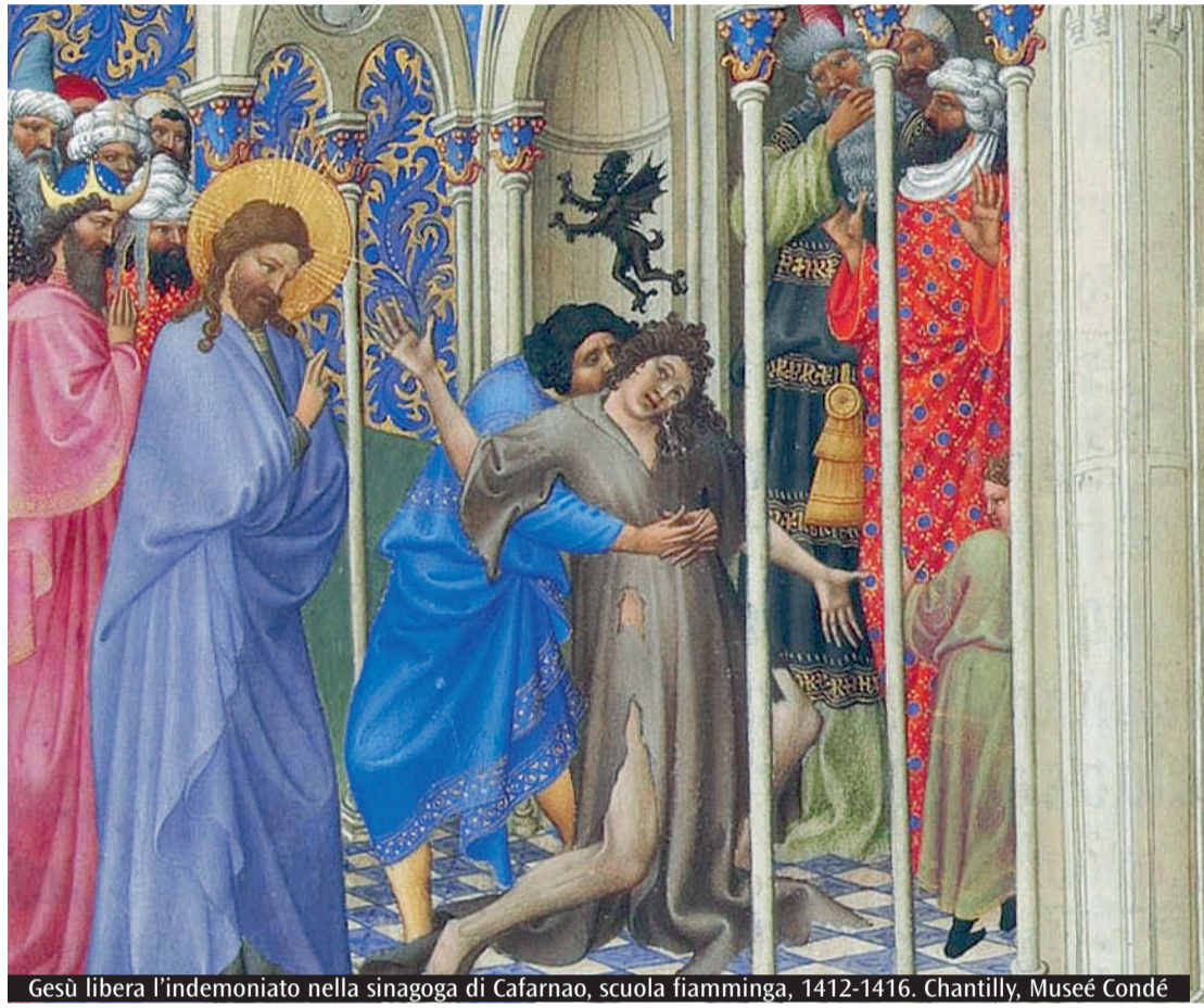
Gesù libera l'indemoniato nella sinagoga di Cafarnaù, scuola fiamminga, 1412-1416. Chantilly, Musée Condé

continuano a prendere appunti su quello che dici vuol dire che stai facendo bene, ma non li hai sorpresi. Quando lasciano cadere la penna e ti guardano mentre parli, allora vuol dire che forse hai toccato il loro cuore». Così doveva risuonare l'insegnamento di Gesù, un «insegnamento nuovo» (Mc 1,27) perché capace di toccare il cuore; così possono risuonare le nostre parole, nella misura in cui ci mettiamo alla scuola di Gesù e impariamo da lui a unire pensiero e vita, fatti e parole, per essere testimoni della verità dell'amore.