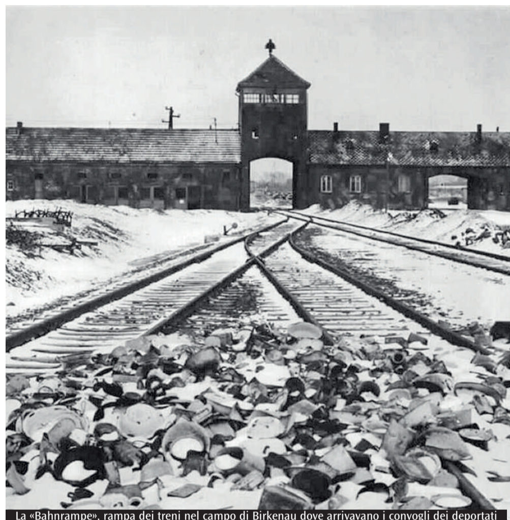
La «Bahnrampe», rampa dei treni nel campo di Birkenau dove arrivavano i convogli dei deportati

contro chi è indifeso e la cui condizione non offre scampo o possibilità di fuga. Il «caso» di Auschwitz, poi, per la Heller, offre un ulteriore elemento di profonda inquietudine. La « Endlösung der Judenfrage » (soluzione finale della questione ebraica) aveva l'obiettivo di eliminare non la maggior parte, ma tutti gli ebrei: per l'ideologia nazista gli ebrei dovevano scomparire dalla terra. E per questo mobilitarono risorse, intelligenze, tecnologia, organizzazione in misura tale da distoglierle dalla stessa propria autoconservazione e infatti il popolo tedesco subì in misura immane la sconfitta militare. Nella follia ideologica, non si trattava solo di infrangere il principio morale naturale del «non uccidere», ma di capovolgerlo nel «tu devi uccidere». La Heller arriva a vedere in Auschwitz come l'assalto dell'uomo al Monte Sinai: eliminando tutti gli ebrei, i nazisti volevano togliere di mezzo ogni possibile testimone dell'Alleanza sancita dalle Tavole della Legge. Spiegato