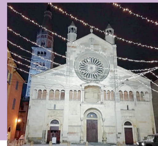
Il Duomo di Modena la notte di Natale