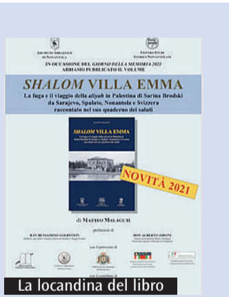
La locandina del libro