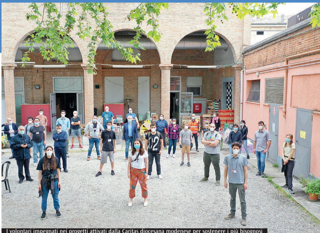
I volontari impegnati nei progetti attivati dalla Caritas diocesana modenese per sostenere i più bisognosi