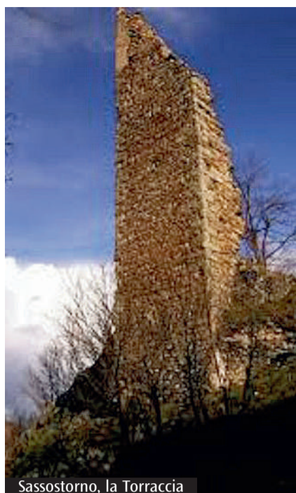
Sassostorno, la Torraccia