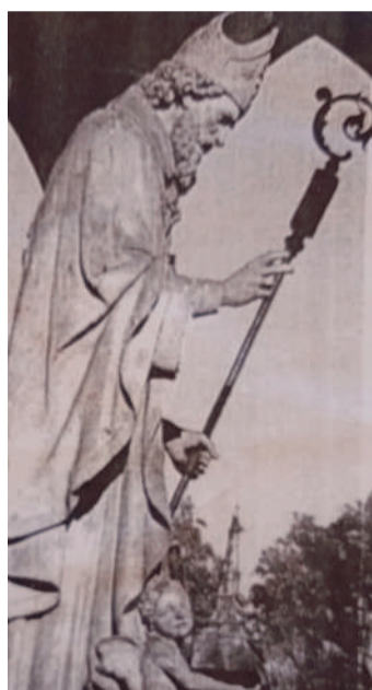
La statua di san Geminiano di Luigi Mainoni (sopra) che troneggia al centro del piccolo tempio votivo costruito a partire dal 1841 (a destra)