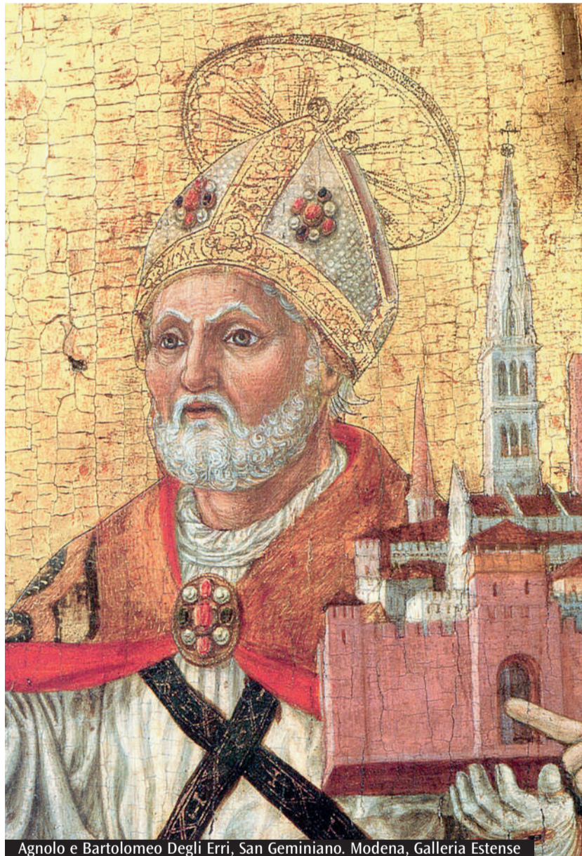
Agnolo e Bartolomeo Degli Erri, San Geminiano. Modena, Galleria Estense

Presso l'Archivio di Stato di Modena si conserva la mole immane delle carte del Governo estense e del carteggio dinastico degli Este e degli Austria-Este. Non mancano... i convenevoli tra sovrani. Così, ci si imbatte in scambi di condoglianze fra Ercole III di Modena e Luigi XVI di Francia, oppure nelle lettere di circostanza della regina Vittoria. Fa un po' sorridere la protestante Vittoria, a capo dell'Inghilterra liberale che si definisce «buona sorella e cugina» del cattolicissimo e antiliberalista Francesco V, ma la politica comporta questo ed altro. Senza dimenticare che gli Hannover - di cui Vittoria era l'ultima discendente - si consideravano imparentati con gli Estensi tramite le comuni origini nella casa dei Guelphi (o Welfen). Un biglietto di Vittoria è del 23 novembre 1848 giunse al Duca, da poco rientrato a Modena dopo la rivoluzione della primavera stessa. Vittoria si congratulava per la nascita della principessa Anna Beatrice Teresa, l'unica figlia di Francesco V e Adelgonda di Baviera, che sarebbe però vissuta meno di un anno. La bambina fu l'unica figlia dell'ultimo Duca di Modena.