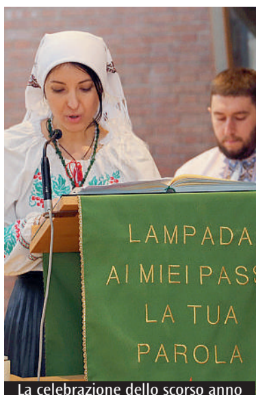
La celebrazione dello scorso anno

Le comunità migranti cattoliche dell'arcidiocesi di Modena-Nonantola e della diocesi di Carpi, le comunità ortodosse rumene di Modena e Carpi, «Missione cristiana libertà» di Modena, «Tefa Colombia», la Commissione ecumenismo e dialogo interreligioso di Modena e di Carpi, gli Uffici Migrantes di Modena e di Carpi promuovono l'appuntamento con l'«Epifania dei popoli», quest'anno in modalità online. In tempo di pandemia, senza la possibilità di trovarsi a pregare tutti assieme in un evento da sempre molto sentito e partecipato, ci si sposterà dunque sul canale Youtube «Arcidiocesi di Modena-Nonantola», al quale si può