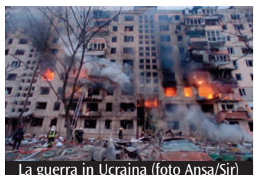
La guerra in Ucraina

«Gli Stati riusciranno a rispettare gli impegni presi o la guerra dell'ultimo zar della Russia e i disagi che ne stanno derivando saranno un comodo alibi per defilarsi?»