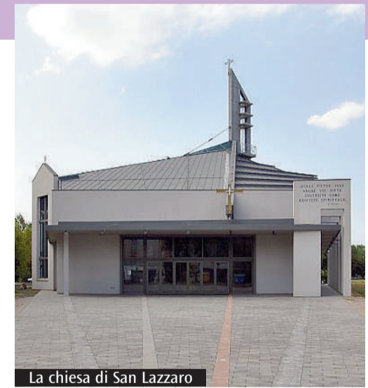
La chiesa di San Lazzaro

Alle 18 in Duomo: Messa nella IV domenica di Quaresima