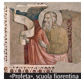
«Profeta», scuola fiorentina

«La lettera di Geremia agli Esiliati - Una versione ebraica» è il titolo della lezione che rav Beniamino Goldstein, rabbino capo della comunità ebraica di Modena e Reggio Emilia, terrà lunedì 28 marzo nel Salone del Palazzo arcivescovile, in corso Duomo 34, in occasione della XXXIII Giornata per l'approfondimento e lo sviluppo del dialogo tra cattolici ed ebrei. La serata, che avrà inizio alle 20.45, era originariamente in programma il 17 gennaio scorso ed è stata spostata a causa della pandemia a