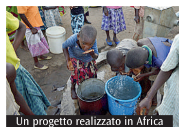
Un progetto realizzato in Africa

L'organizzazione di volontariato di Modena ha realizzato 47 progetti umanitari in 14 Paesi. Domani udienza dal Papa, martedì al cinema Astra la serata per il decennale