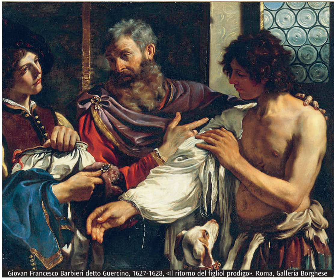
Giovan Francesco Barbieri detto Guercino, 1627-1628, «Il ritorno del figliol prodigo». Roma, Galleria Borghese

Interessante il verbo greco «apollomi» con il quale si traduce anche la frase del figlio prodigo: «Quanti salariati di mio padre hanno pane in abbondanza e io qui muoio di fame!». Quel «muoio di fame» in realtà è meglio traducibile con: «e io ho una vita distrutta». Allora gioiamo insieme a Dio per ogni persona che si lascia «ritrovare»: solo così potremo vivere come fratelli il versetto del Vangelo che dice: «Questa è la volontà del Padre vostro che è nei cieli, che neanche uno di questi piccoli si perda» (Mt. 18,14)