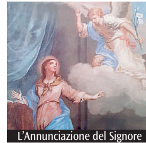
L'Annunciazione del Signore