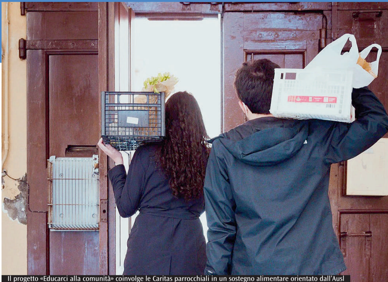
Il progetto «Educarci alla comunità» coinvolge le Caritas parrocchiali in un sostegno alimentare orientato dall'Ausl

Domani si terrà l'inaugurazione del rinnovato magazzino alimentare nei locali parrocchiali di Santa Rita, con la «Festa di primavera»