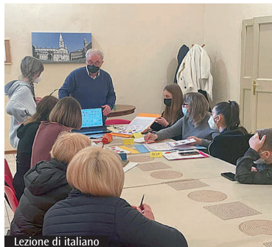
Lezione di italiano

«Siate premurosi nell'ospitalità»: le parole scritte da san Paolo nella lettera ai Romani (cap. 12,13) ci restituiscono l'immagine di una comunità che accoglie, che si aiuta a vicenda. Queste parole contengono anche un mandato per i nostri giorni, dove l'emergenza profughi derivante dalla guerra in Ucraina esige risposte sempre più concrete da parte di ciascuno di noi. Risposte che non possono essere date rispondendo al male con il male, ma che richiedono di rispondere al male con il bene, come lo indica l'Apostolo delle genti qualche