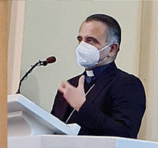
Sopra monsignor Erio Castellucci durante la riflessione nel primo Martedì del vescovo organizzato in Appennino e a destra i tanti giovani presenti nella chiesa di Palagano