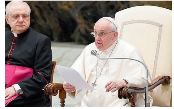
Papa Francesco in Aula Paolo VI durante la catechesi dell'udienza generale di mercoledì scorso, la seconda del ciclo dedicato al tema della vecchiaia

La settimana del Papa di Cecilia Mariotto e Giorgia Pelati