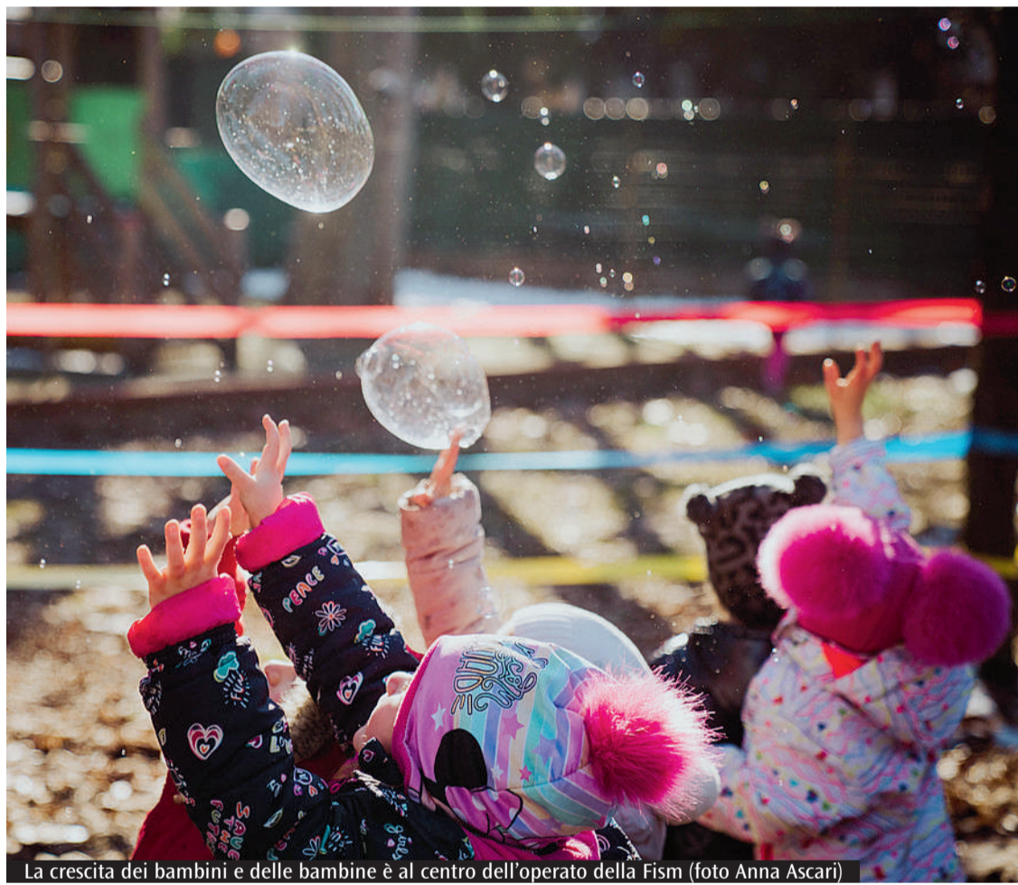
La crescita dei bambini e delle bambine è al centro dell'operato della Fism