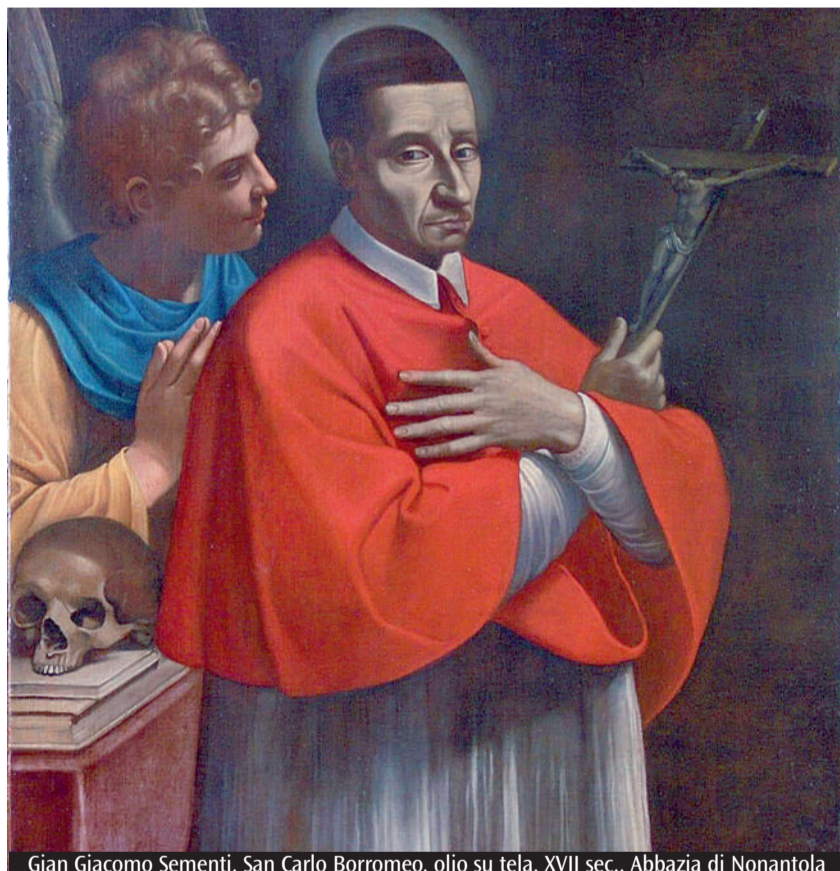
Gian Giacomo Sementi, San Carlo Borromeo, olio su tela, XVII sec., Abbazia di Nonantola

Tutto questo delinea il ruolo del pastore non come qualcosa di grandioso, ma come un servizio estremamente umile in cui le molte gioie sono bilanciate da numerose fatiche. Proprio per questa ragione tale servizio non può essere accettato senza aver imparato a gioire della comunione con Dio che c'è stata donata in Gesù grazie al dono dello Spirito, e a porre tale gioia a fondamento della propria vita. A volte nella vita di un pastore - come pure di molti altri cristiani - è questa l'unica vera consolazione a cui si può attingere per restare umilmente al proprio posto rifiutando l'arroganza.