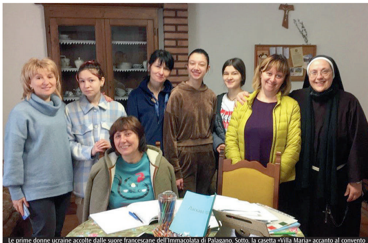
Le prime donne ucraine accolte dalle suore francescane dell'Immacolata di Palagano. Sotto, la casetta «Villa Maria» accanto al convento

mentali burocratici (negli uffici dell'Asl e in Questura) già vediamo i loro volti più distesi e sorridenti, nonostante la preoccupazione per i loro cari lontani e per il futuro incerto. Questa accoglienza è un'azione corale, in cui tutti fanno del proprio meglio con il coordinamento delle istituzioni: i volontari dell'Avap, che si preoccupano dei trasporti e della spesa, la Caritas parrocchiale che gestisce la raccolta dei generi alimentari e del vestiario, i medici che si sono messi a disposizione per qualsiasi necessità, il forno che ogni giorno regala il pane, quelli che offrono accessori per la casa, insomma la generosità delle persone non si è fatta attendere... Fondamentale è stato e continua ad essere l'aiuto