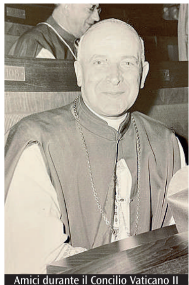
Amici durante il Concilio Vaticano II

Scriva papa Giovanni XXIII nella sua agenda al Venerdì Santo 15 aprile 1960: «Ieri e oggi lessi con viva attenzione la lettera collettiva di tutto l'Episcopato italiano ai sacerdoti, dal tema: "La Chiesa e il laicismo". È una esposizione calma, serena, magistrale, degna di tradursi bene nella testa e nella pratica di ogni buon sacerdote. Converterà tornarci sopra. L'estensione è dell'arcivescovo di Modena monsignor Giuseppe Amici. Fu sottoscritta da tutti i Vescovi d'Italia ed ebbe suggerimenti in Segreteria di Stato. Converterà renderla familiare». Sembra che il tema fosse stato indicato dal cardinale Giuseppe Siri, allora arcivescovo di Genova e presidente Cei e con la collaborazione di Pietro Pavan, futuro cardinale. Monsignor Giuseppe Amici nasce a Sant'Angelo Lodigiano, ove nac-