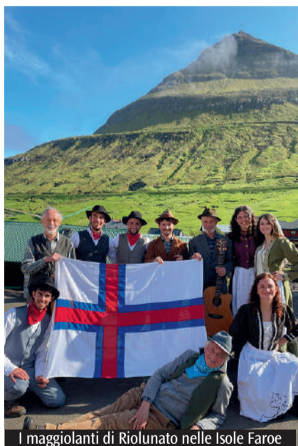
I maggiolanti di Riolutano nelle Isole Faroe

Era anche il mese del rosario, che dal 22 al 31 maggio è stato recitato nel Santuario ed è stato trasmesso dall'emittente locale TvQui.