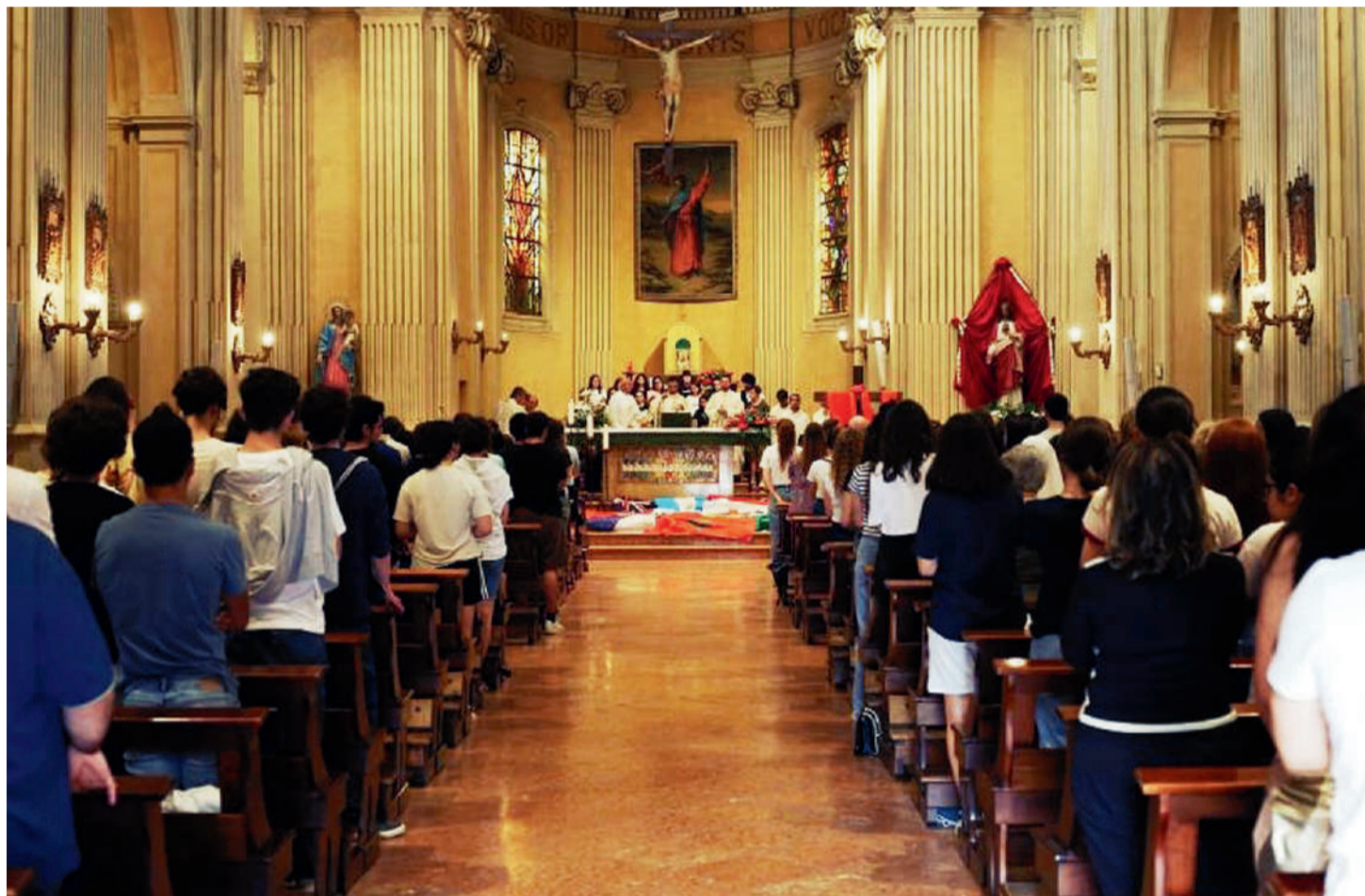
La Messa di invio dedicata alla Gmg si è tenuta mercoledì scorso, nella parrocchia di Formigine, alla presenza di centinaia di giovani. Ha presieduto la celebrazione l'arcivescovo Erio Castellucci

C'è chi invece arriverà direttamente a Lisbona, partendo nella notte tra il 29 e 30 luglio, con sosta ad Avignone e a Lourdes. L'arrivo nella capitale portoghese è previsto per il 31 luglio, nel tardo pomeriggio. Dal 1° agosto si entrerà nel pieno della Giornata mondiale, con un calendario fitto di appuntamenti che vanno dalla Messa di apertura presieduta dal Patriarca di Lisbona alla Veglia che si terrà il 5 agosto, alle 10.45, nel Campo da Graça .