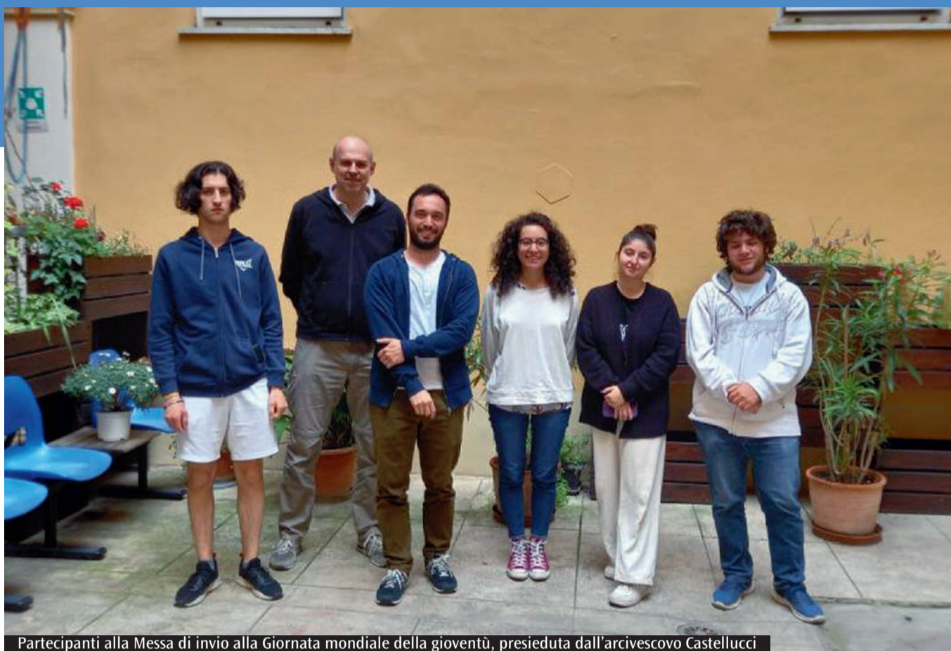
Partecipanti alla Messa di invio alla Giornata mondiale della gioventù, presieduta dall'arcivescovo Castellucci