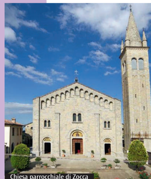
Chiesa parrocchiale di Zocca