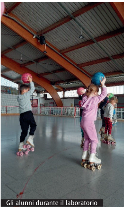
Gli alunni durante il laboratorio