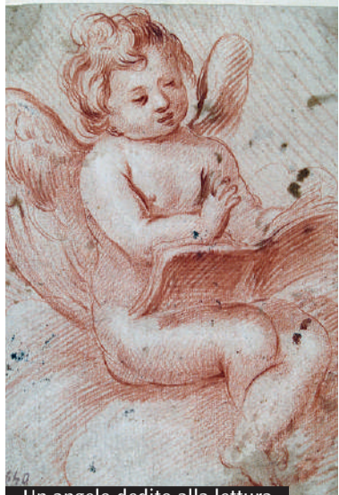
Un angelo dedito alla lettura