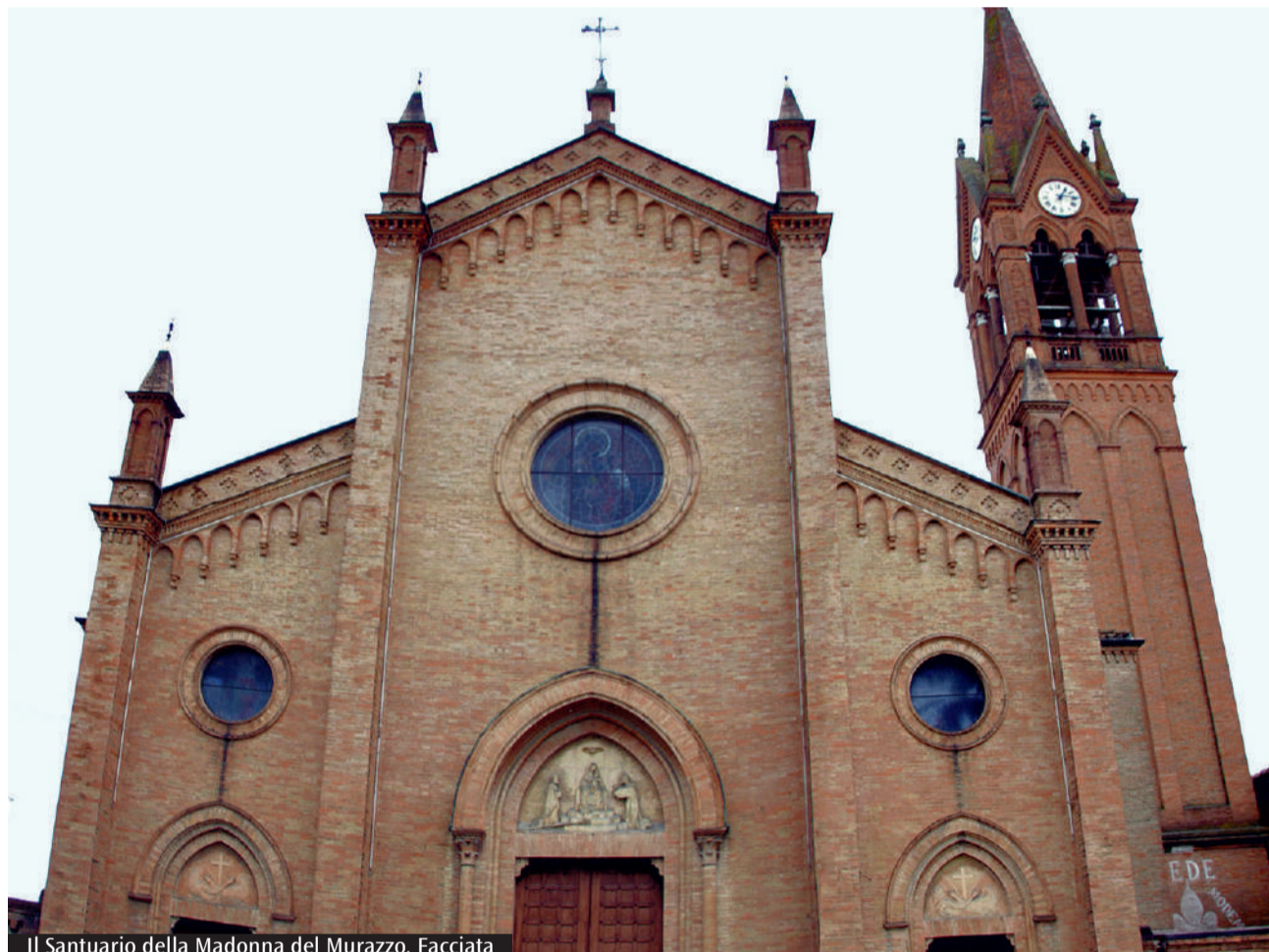
Il Santuario della Madonna del Murazzo. Facciata