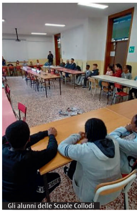
Gli alunni delle Scuole Colodi

«Al ritorno abbiamo cercato di costruire qualcosa: una piccola agorà, ed è qui che tutto il nostro lavoro ha preso il nome di Cantiere formativo» raccontano i bambini descrivendo il percorso finanziato con i fondi 8xmille della Cei.