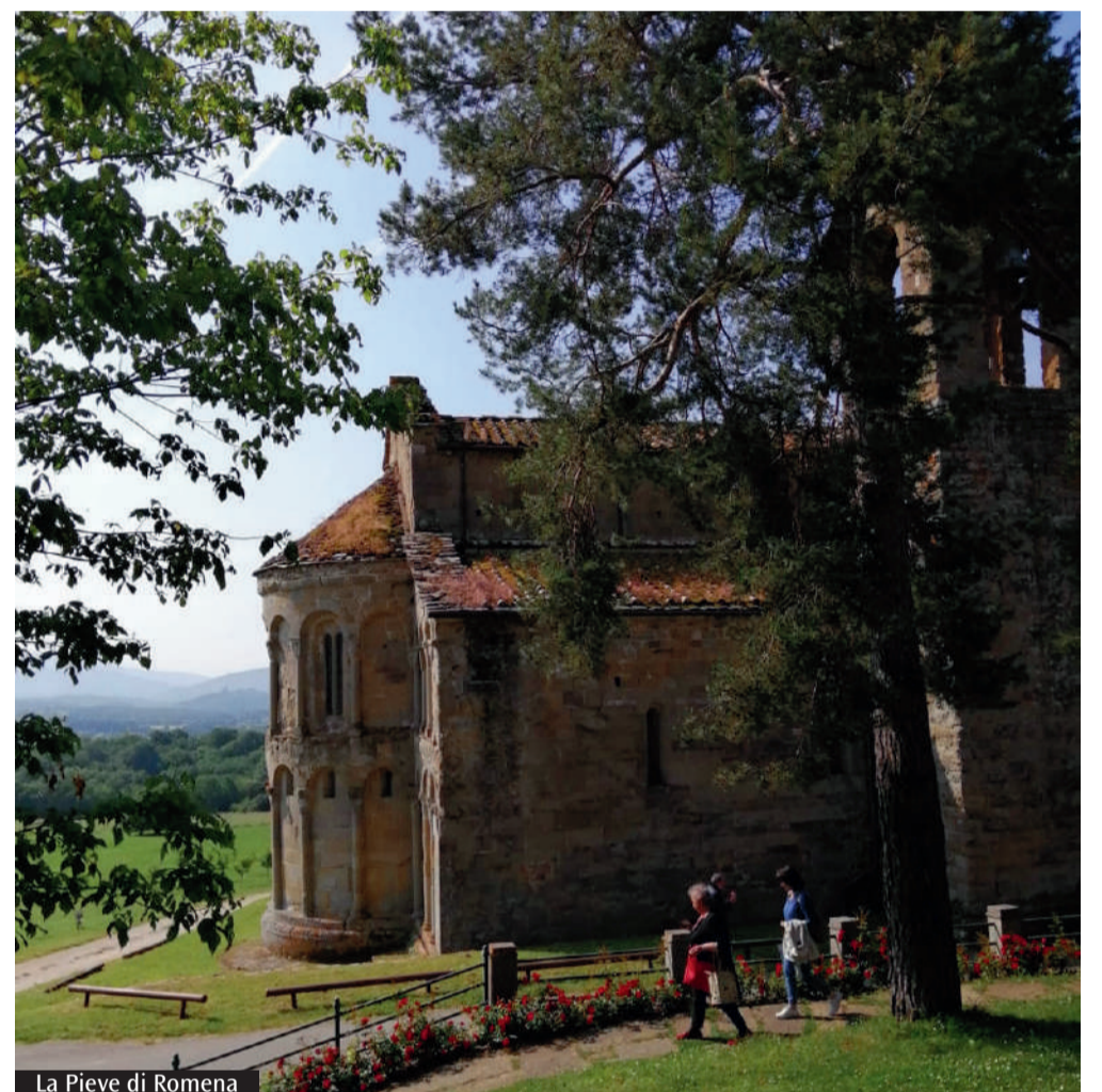
La Pieve di Romena