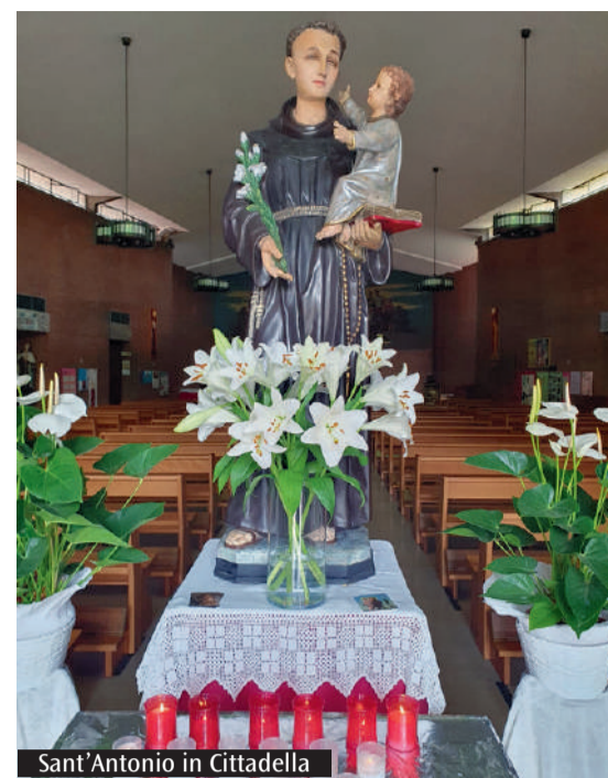
Sant'Antonio in Cittadella