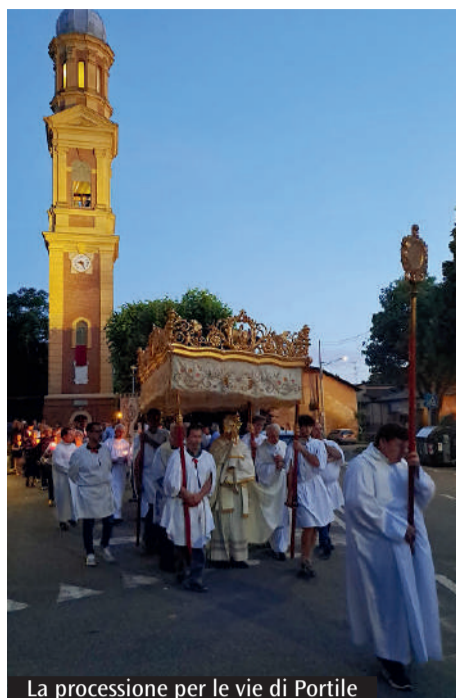
La processione per le vie di Portile

baldacchino della Confraternita del Santissimo Sacramento e, a seguire, una doppia lunga fila illuminata dalle fiaccole dei fedeli che, con devozione e raccoglimento, hanno pregato e cantato i brani proposti dalla banda. Erano presenti, coi genitori, alcuni bambini: i loro sguardi esprimevano immensa gioia e stupore per quel clima reso festoso dal suono della banda e suggestivo per le luci delle candelie. Dopo la conclusione con la Benedizione eucaristica, sono iniziati i commenti: una soddisfazione generale per il personale arricchimento spirituale ricevuto dalla celebrazione, ma anche il piacere di sentirsi più uniti e più amici ai tanti fratelli delle parrocchie vicine.