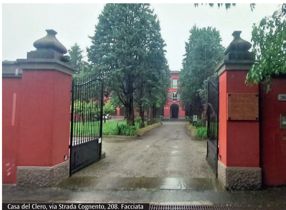
Casa del Clero, via Strada Cognento, 208. Facciata