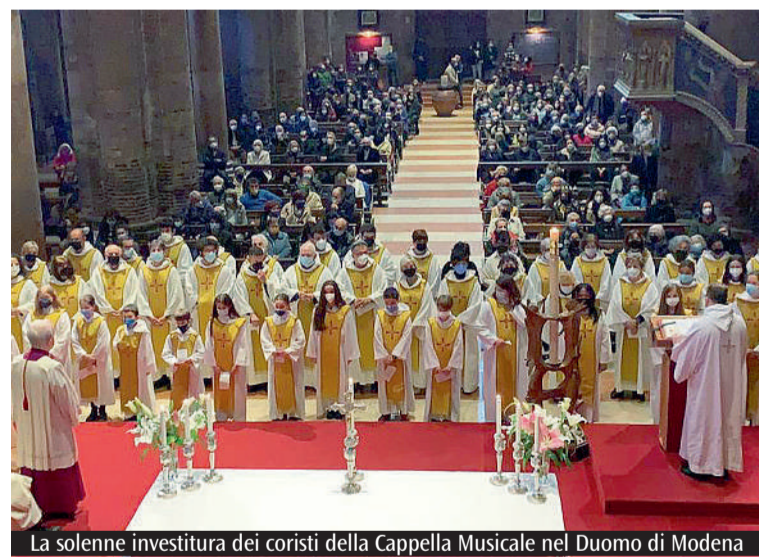
La solenne investitura dei coristi della Cappella Musicale nel Duomo di Modena

Cappella Musicale del Duomo è possibile grazie a Bper Banca, Fondazione di Modena, Comune di Modena, Caprari Spa, Clal, gli Amici del Duomo di Modena, il Capitolo Metropolitano della Cattedrale oltre ai coristi e privati che collaborano nello svolgimento delle attività. Alla luce dei traguardi raggiunti, la Cappella Musicale del Duomo sta realizzando una progettazione finalizzata ad arricchire la prossima stagione concertistica (2022-2023), che avrà la finalità di coinvolgere e animare la cittadinanza tutta. Un'opportunità per «formare delle voci, unendole nel canto polifonico, perché appaia la bellezza nella quale si sente presente in mezzo a noi la liturgia celeste», come affermato da Benedetto XVI. Un'occasione per riconoscere il patrimonio storico, artistico e culturale come «base per costruire una città abitabile» (Laudato si', n.143).