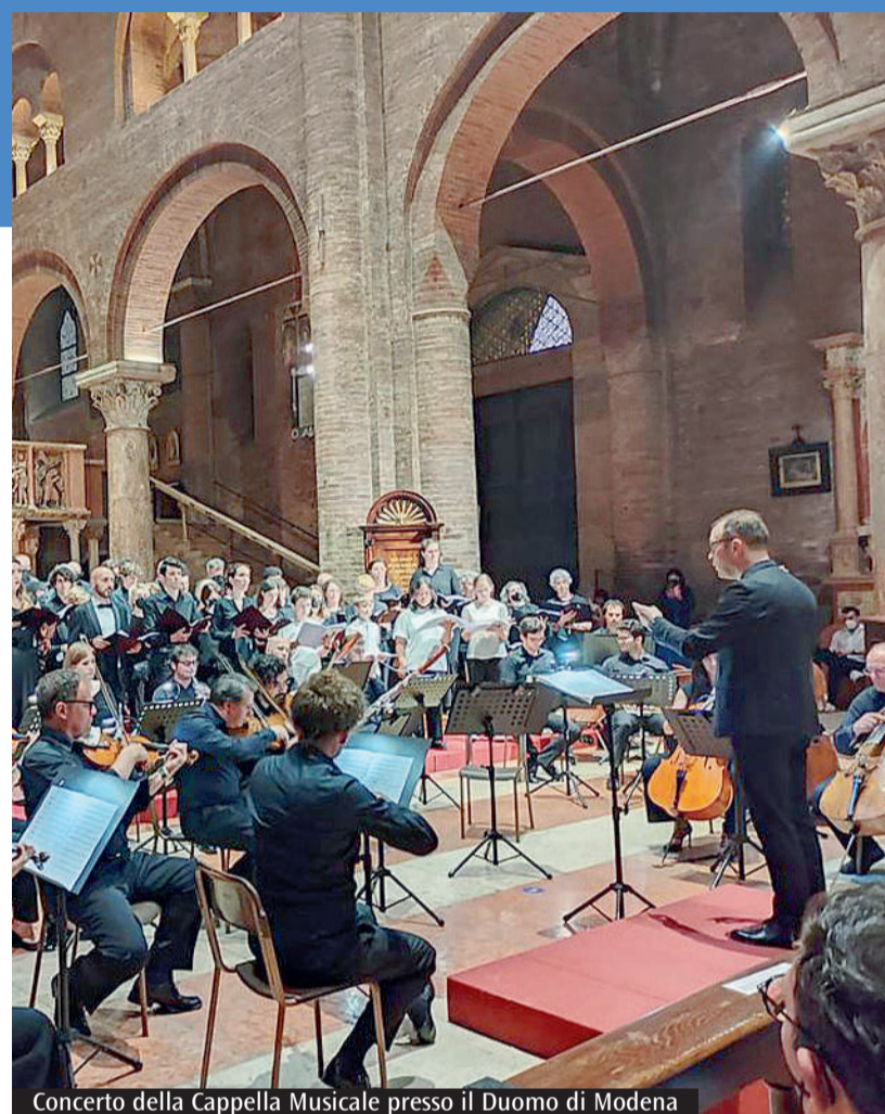
Concerto della Cappella Musicale presso il Duomo di Modena

La Cattedrale e la Chiesa del Voto sono state le sedi principali di concerti finalizzati a coinvolgere tutta la cittadinanza intorno al linguaggio della musica, capace di far incontrare persone provenienti da realtà differenti