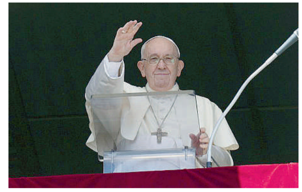
Il saluto del Papa ai fedeli in Piazza San Pietro domenica scorsa per l'Angelus, dopo aver commentato il Vangelo del Buon Samaritano

La settimana del Papa di Cecilia Mariotto e Giorgia Pelati