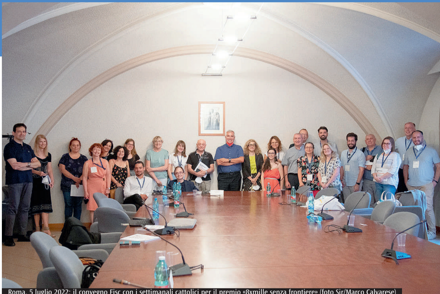
Roma, 5 luglio 2022: il convegno Fisc con i settimanali cattolici per il premio «8xmille senza frontiere»