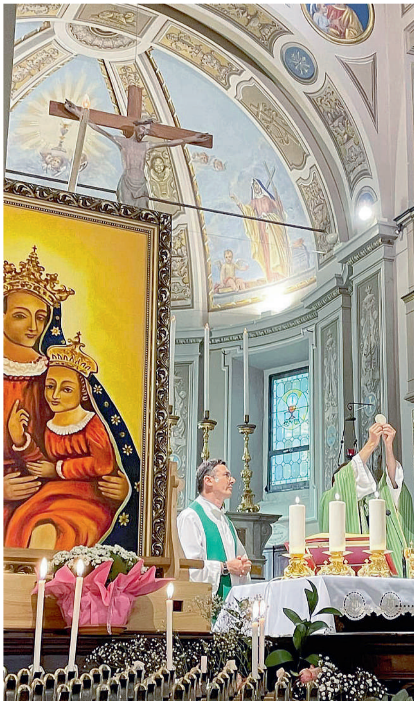
La celebrazione eucaristica nella chiesa parrocchiale di Sestola, dedicata a San Nicolò di Bari, prima dell'esibizione dei The Vigil Project e dell'Adorazione