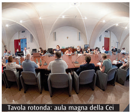
Tavola rotonda: aula magna della Cei

partecipazione: a monopolizzare il discorso sono temi come l'aiuto ai migranti, la ricchezza della Chiesa, l'abolizione del concordato, le ingerenze nella politica e altri discorsi che vengono spesso decontestualizzati da uno stile dove l'informazione non è il fine ma un mezzo per intrattenere gli internauti. Ma in che modo possiamo comunicare in maniera efficace? È ancora possibile, per la Chiesa, generare appartenenza e senso di responsabilità attraverso la comunicazione sociale? Difficile rispondere con certezza in una società dove, dal 2010 al 2020 la carta stampata ha perso sempre più potere (da 77,4 al 42 punti), l'Internet ha raggiunto 54 milioni di italiani e i contenuti prodotti dagli utenti social (i cosiddetti influencer) appaiono più autentici agli occhi dell'opinione pubblica contemporanea rispetto alle informazioni prodotte dalle testate più credibili. Notiamo così che i mutamenti avvengono in fretta ma la nostra comunità civile ed ecclesiale fa sempre più fatica ad adattarsene, divenendo straniera a questa epoca di cambiamenti. Vi è inoltre