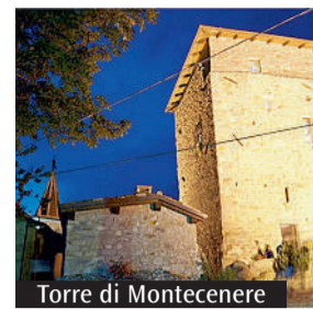
Torre di Montecenero