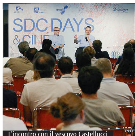
L'incontro con il vescovo Castellucci

L'intervento del vescovo Castellucci per l'evento «Sdc days» a Riccione, convention delle Sale della comunità che è tornata a svolgersi in presenza