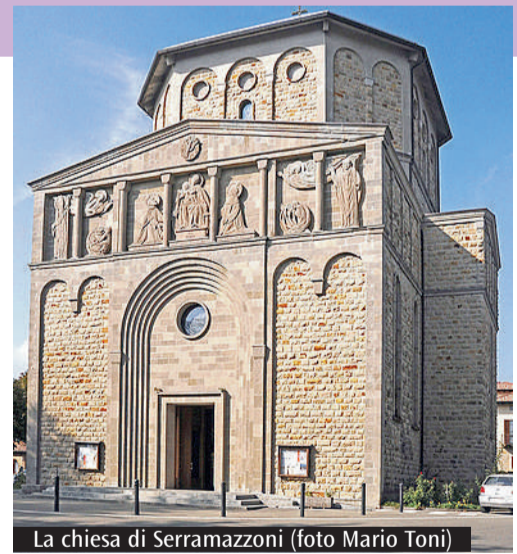
La chiesa di Serramazzoni