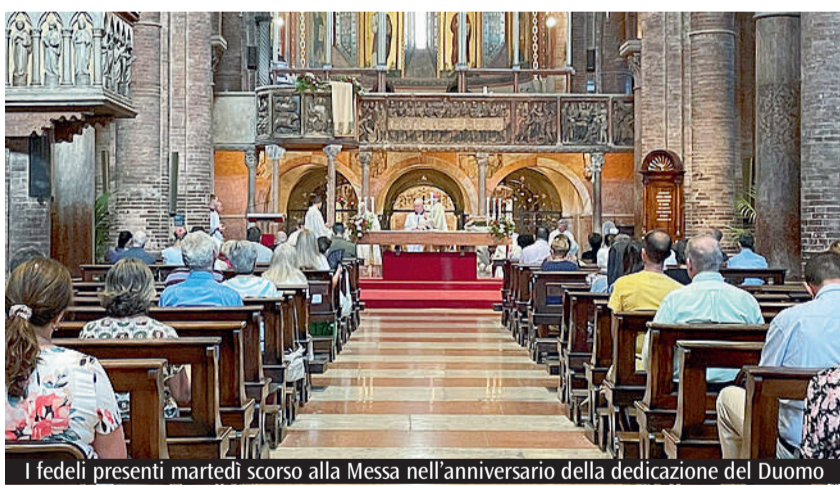
I fedeli presenti martedì scorso alla Messa nell'anniversario della dedizione del Duomo