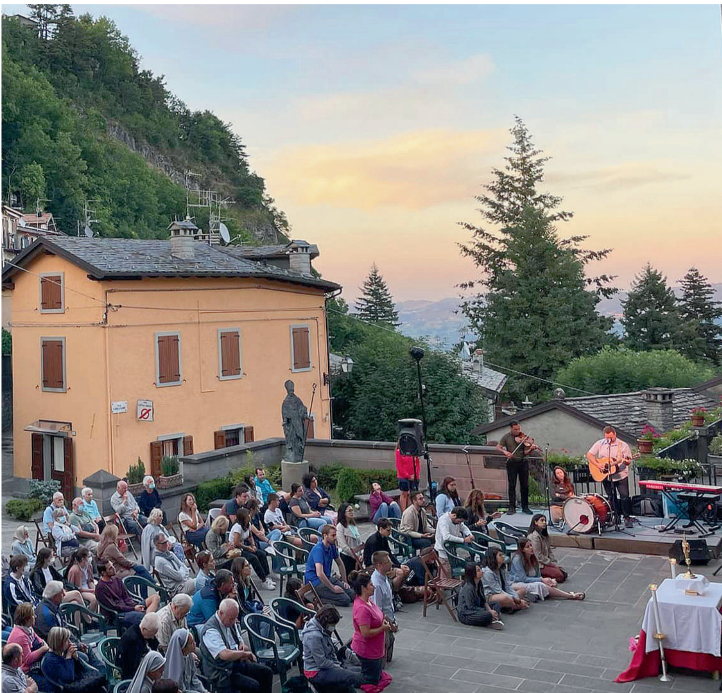
L'Adorazione sul sagrato della chiesa parrocchiale di San Nicolò, a Sestola, accompagnata dalla musica e dai canti del gruppo statunitense di musica cristiana The Vigil Project