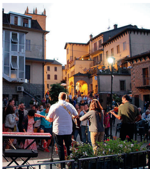
L'esibizione dei The Vigil Project a Sestola nella serata di sabato 9 luglio, appuntamento appenninico al quale hanno partecipato tanti giovani della diocesi oltre a quelli della locale comunità parrocchiale di San Nicolò di Bari