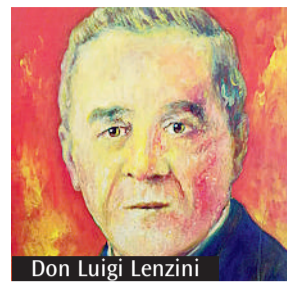
Don Luigi Lenzini

Giovedì 21 luglio sarà celebrata per la prima volta la memoria liturgica del beato Luigi Lenzini, sacerdote e martire. Nel giorno della memoria liturgica avrà luogo in particolare una celebrazione a Crocette di Pavullo nel Frignano, presieduta alle 20.30 dall'arcivescovo Erio Castellucci e preceduta dall'adorazione eucaristica (alle 19) e dalla processione dal cippo del martirio e litanie dei santi (alle 20). Anche a Fiumalbo, paese natale del beato, verrà celebrata una Messa alle 11. Domenica 31 luglio, sempre a Fiumalbo, sarà l'arcivescovo Castellucci a presiedere alle 11 una Messa solenne in memoria del beato.