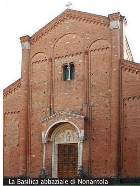
La Basilica abbaziale di Nonantola