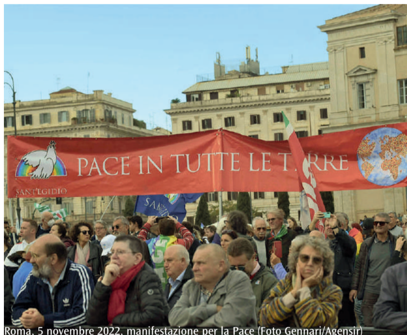
Roma, 5 novembre 2022, manifestazione per la Pace

Il teologo riformato intende parlare proprio della superpotenza che guida l'Occidente, gli Stati Uniti d'America che egli non esita a riconoscere come una «creatura della guerra», «una so-