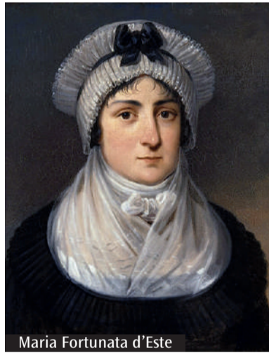
Maria Fortunata d'Este

Maria Fortunata (1731-1803), figlia di Francesco III, fu «vittima» di un matrimonio di Stato