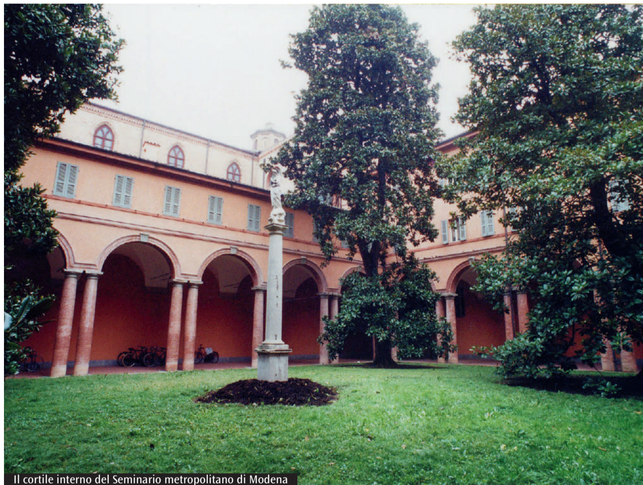
Il cortile interno del Seminario metropolitano di Modena