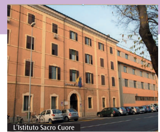
L'Istituto Sacro Cuore