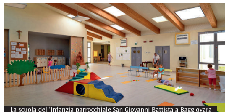
La scuola dell'infanzia parrocchiale San Giovanni Battista a Baggiovara