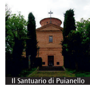
Il Santuario di Puianello

In preparazione alla Gmg di Lisbona è previsto a Modena la Gmg interdiocesana intitolata «Si alzò e se ne andò in fretta» promossa dai servizi di Pastorale giovanile delle diocesi di Modena-Nonantola e Carpi. Domenica prossima, 20 novembre, nei locali dell'Istituto Sacro Cuore, l'evento inizierà alle 16, seguita dalle testimonianze, catechesi del vescovo e lancio dei pacchetti per la Gmg Lisbona; a seguire cammino verso il centro storico di Modena e arrivo nella chiesa di Sant'Agostino con preghiera di affidamento Gmg. Alle 19 l'aperitivo conclusivo si terrà alla mensa Ghirlandina di via Leodoino 9.