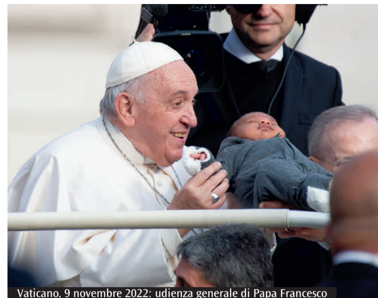
Vaticano, 9 novembre 2022: udienza generale di Papa Francesco

chiamati a dilatare gli orizzonti». Poi l'appello finale, a braccio: «Per favore, cuori dilatati, non questi cuori chiusi, duri, perché questa fratellanza umana vada più avanti per aprirci e allargare gli interessi, a dedicarci alla conoscenza degli altri». «Se tu ti dedichi alla conoscenza degli altri, mai sarai minacciato - ha concluso il Papa ancora fuori testo - ma se tu hai paura, tu stesso sarai minacciato. Dio tende la mano, ma se dall'altra parte non c'è l'altra mano, non serve. Perché il cammino della fraternità e della pace, per procedere, ha bisogno di tutti e di ciascuno».