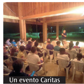
Un evento Caritas

«Costruire una scuola inclusiva capace di abbattere le barriere culturali che allontanano famiglie e bambini dalla partecipazione alla vita della città; una scuola capace di educare alla cittadinanza e rimuovere - parafrasando l'art. 3 della Costituzione - gli ostacoli che impediscono il fiorire dei talenti e le capacità delle future generazioni». Questi alcuni dei pensieri condivisi all'incontro «Casa-scuola-quartiere», tenutosi il 3 novembre a Santa Caterina: confronto promosso da Caritas diocesana e condotto dal prof. Alessandro Tolomelli per dare continuità al progetto «Città abilitabile» che ha il mandato diocesano di promuovere una