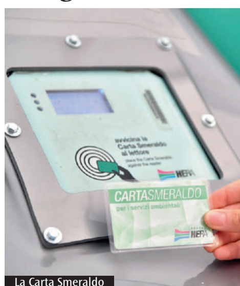
La Carta Smeraldo

È in corso, a Modena, la riorganizzazione dei servizi ambientali, come previsto dalla concessione affidata, tramite procedura di gara, da Ateris al Raggruppamento temporaneo di imprese (Rti), costituito tra Hera S.p.A., Giacomo Brodolini Soc. Coop e Consorzio Stabile Ecolib. Con la riorganizzazione, cittadini e imprese modenesi avranno a disposizione due modelli di raccolta rifiuti: una parte della città, composta dal centro storico, dalle Zai (Zone artigianali e industriali) e dal forese - la periferia a bassa densità abitativa della città - sarà servita dal porta a porta integrale. In queste zone ci saranno raccolte domiciliari per tutte le principali tipologie di rifiuti. Nei centri abitati delle frazioni e nei quartieri residenziali della città ci sarà invece un sistema misto, in cui le