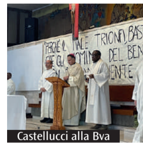
Castellucci alla Bva

L'arcivescovo Castellucci, in visita pastorale alla comunità della Bva di Modena, ha presieduto la Celebrazione eucaristica che si è conclusa con la consacrazione della parrocchia alla Beata Vergine Addolorata. Un momento davvero speciale vissuto in un clima familiare di preghiera che ha visto coinvolte molte persone. «La morte è il grande enigma e chi cerca di censurare la morte e di evitare il pensiero della fine, rischia di disperarsi quando viene a contatto con questa esperienza. Chi vuole vivere saggiamente deve pen-