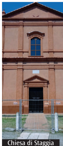
Chiesa di Staggia