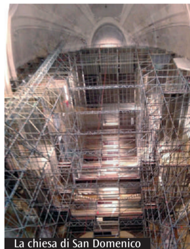
La chiesa di San Domenico

L'evoluzione degli interventi post-terremoto nel territorio diocesano. Lo stato attuale dei lavori