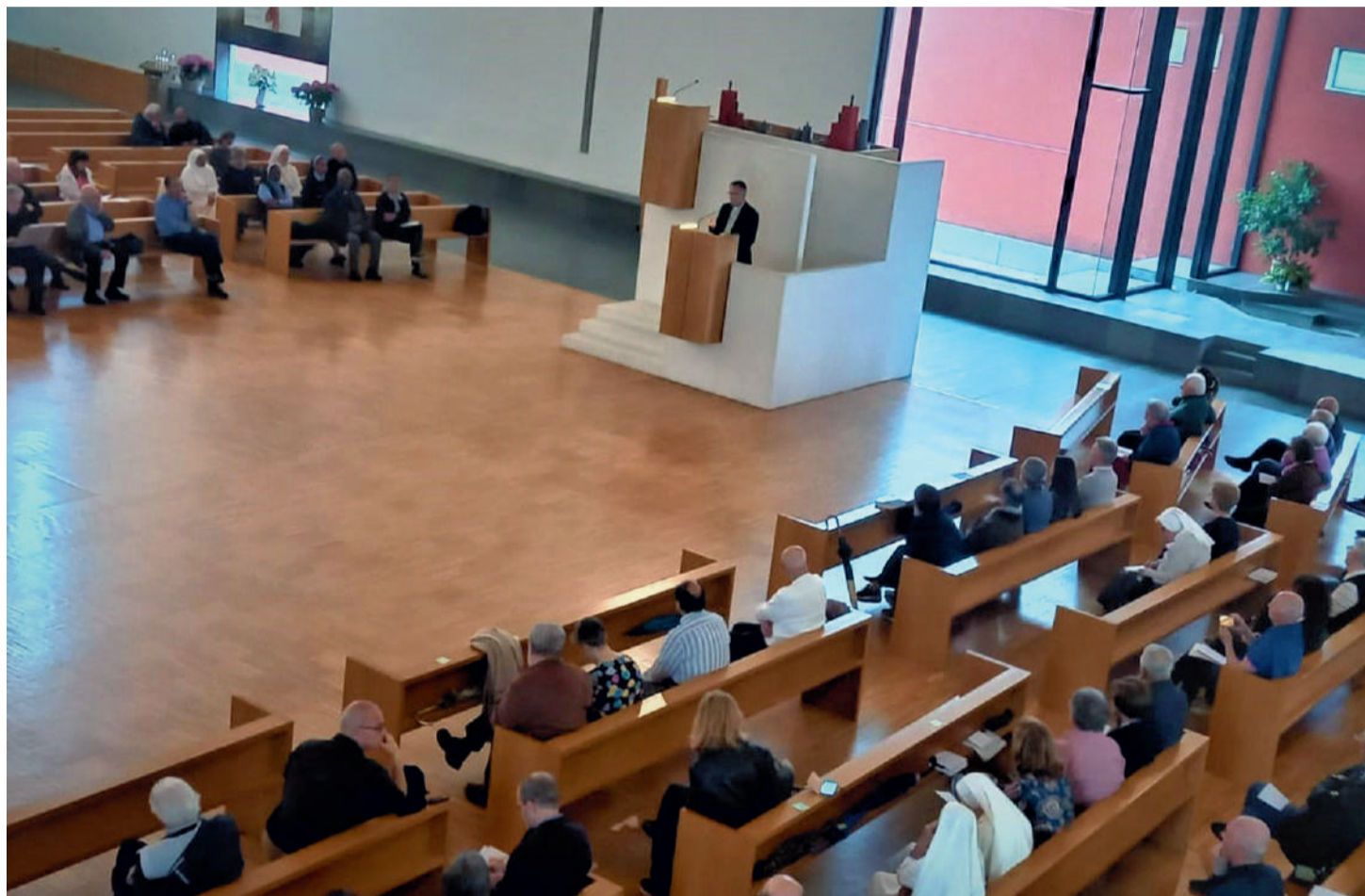
L'intervento dell'arcivescovo Castellucci in occasione della chiusura dell'Anno pastorale tenutosi lo scorso 5 giugno nella parrocchia di Ges  Redentore

Luned  5 giugno presso la parrocchia di Ges  Redentore si   svolta l'Assemblea diocesana di fine anno pastorale, assise che non poteva non mettere al centro il tema del cammino sinodale che si sta svolgendo nella nostra diocesi e nella Chiesa italiana. Dopo la preghiera iniziale ha avuto luogo una introduzione biblica di don Claudio Arletti a commento del brano di Genesi (18), il testo che racconta l'ospitalit  di Abramo ai tre misteriosi visitatori e che a conclusione dell'accoglienza ricevuta dal patriarca, annunciano la nascita del figlio tanto atteso: Isacco. Ha poi preso parola l'arcivescovo, che ha descritto il cammino sinodale fin qui compiuto nella diocesi: due anni in cui si sono raccolti suggerimenti, critiche e esperienze. Questo cammino si   arricchito anche dell'esperienza dei cantieri sinodali, che si sono confrontati con vari «mondi». Da oggi, ha detto Castellucci, inizia la «fase sapienziale», che coinvolger  tutta la Chiesa italiana e la nostra diocesi in un discernimento per far tesoro di quanto emerso nei primi due anni e per approfondirlo in prospettiva spirituale, nel quale «cercheremo di comprendere cosa dobbiamo cambiare nella nostra Chiesa per far risplendere di pi  il Vangelo». Ci  ricorda lo scopo del Concilio Vaticano II negli auspici di san Giovanni XXIII: far incontrare la gente con il Vangelo e rendere pi  trasparente la vita cristiana