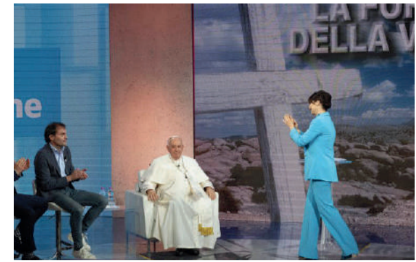
Il Pontefice ha partecipato alla trasmissione "A sua immagine" lo scorso sabato 27 maggio. La puntata è stata trasmessa domenica 28 maggio.