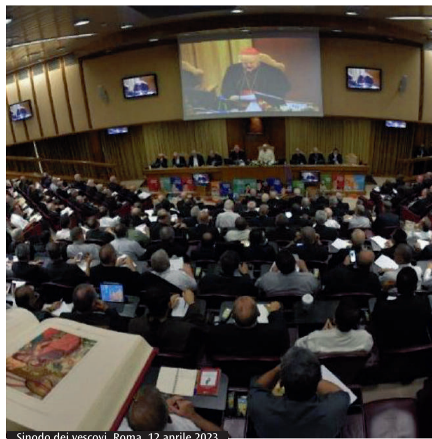
Sinodo dei vescovi, Roma, 12 aprile 2023

Meglio, quindi, un leader "indecisionale" che ha tante idee straordinarie ma che sul piano operativo fa solo tanta confusione? Certamente, sebbene lo stile ideale resti quello trasparente, che sa lasciarsi guidare dalla ricerca di ciò che è vero e buono senza aver paura del conflitto, e che sa realizzare dei cambiamenti della prassi senza lasciarsi paralizzare dalla paura di commettere errori. Questo approccio, però, suppone comunità cristiane che, pur mantenendo la comunione sugli aspetti essenziali dell'esperienza cristiana, siano disponibili ad accettare una certa conflittualità interna per mettersi effettivamente in cammino. In caso contrario, le questioni poste da persone libere con lo stile della trasparenza sarebbero salutate dal solito silenzio imbarazzato e cadrebbero presto nell'oblio.