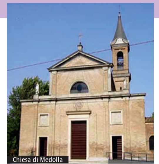
Chiesa di Medolla

Un video che racconta l'attività svolta dai bambini delle scuole Collodi nella cornice del laboratorio «Per conoscere, amare e prendersi cura del luogo dove vivo e dove vado a scuola». Il cortometraggio, della durata di circa tre minuti, è stato presentato lo scorso 5 giugno, in occasione del convegno «Una promessa di felicità, formare alla bellezza per contrastare la povertà educativa». Il video è stato promosso dall'Istituto comprensivo 10, tra i candidati alla selezione delle delegazioni scolastiche proposta dal ministero dell'Istruzione e del Merito. La sua realizzazione è stata sostenuta dai fondi 8xmille Cei del progetto Fiducia nella città di Caritas diocesana. Gli istituti selezionati parteciperanno alla Cerimonia d'inaugurazione dell'Anno scolastico 2023-2024, che si svolgerà a settembre alla presenza del Presidente della Repubblica e altre autorità.