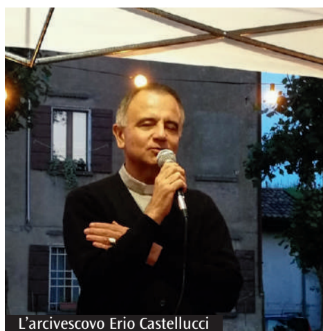
L'arcivescovo Erio Castellucci

È possibile sostenere l'azione delle Chiese locali a beneficio delle famiglie alluvionate realizzando un bonifico all'Iban IT89B53871290000000030436 con la causale «Emergenza alluvione Emilia-Romagna - Caritas Italiana».