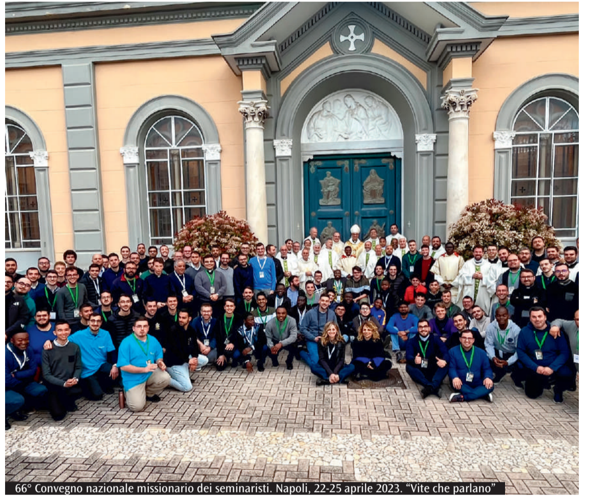
66° Convegno nazionale missionario dei seminaristi. Napoli, 22-25 aprile 2023. "Vite che parlano"