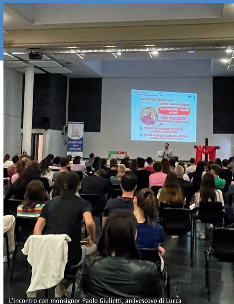
L'incontro con monsignor Paolo Giulietti, arcivescovo di Lucca

Per l'arcivescovo di Lucca, Paolo Giulietti, «la Gmg è un'opportunità per costruire legami che vanno mantenuti nel tempo» In 150 hanno partecipato al momento formativo Il prossimo incontro si terrà a Formigine