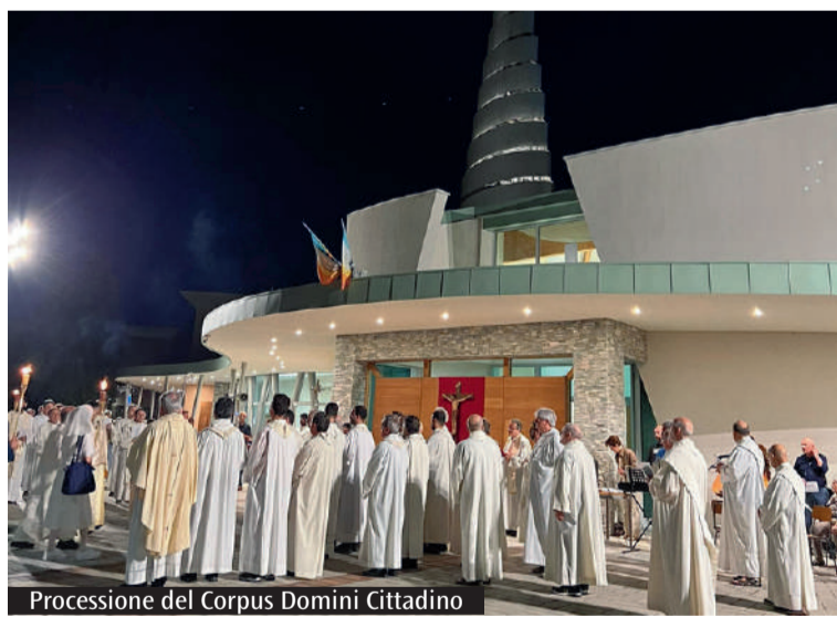
Processione del Corpus Domini Cittadino