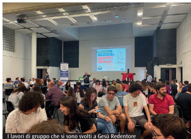
I lavori di gruppo che si sono svolti a Gesù Redentore

zioni che saranno nate durante la giornata». «La sfida - conclude - consiste nel trasformare il vissuto in esperienza, ossia in apprendimenti utili a facilitare il percorso di chi stiamo accompagnando e un'adeguata rielaborazione di un vissuto che va raccontato alle comunità che ci inviano». Quello di Gesù Redentore è stato il primo di tre incontri di preparazione verso la Giornata mondiale della gioventù, che proseguiranno a Formigine e si concluderanno a Nonantola. Un percorso necessario, a quattro di anni di distanza dall'ultima Giornata mondiale, a Panama, la cui distanza atlantica ha limitato una più ampia partecipazione delle diocesi italiane. L'ultimo ricordo vicino risale dunque al 2016, a Cracovia. Luogo che non poteva non evocare il ricordo di Giovanni Paolo II, che, dal 1985, si fece padre e promotore dell'iniziativa, attribuendo il merito agli stessi giovani («I giovani le hanno create»). E a lui che si devono il primo accompagnamento, i primi legami, la prima esperienza suscitata.