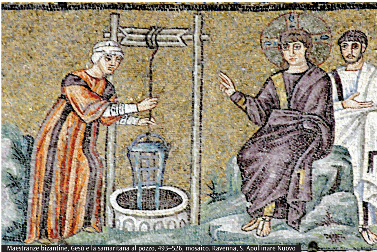
Maestranze bizantine, Gesù e la samaritana al pozzo, 493-526, mosaico, Ravenna, S. Apollinare Nuovo

credibile. La donna vuole portarla alla luce. Diversamente, come chiede, perché mai un giudeo dovrebbe rivolgersi ad una donna samaritana? Il sesso dell'interlocutrice, nella sua risposta, è ben marcato, a differenza di quello di Gesù. La disistima che si ha di sé è il primo pregiudizio che scredita l'attenzione altrui, riducendola sempre a una cattiva e pericolosa attenzione. Eppure proprio l'amore di Dio e il suo farsi mendicante sono il primo correttivo ai nostri momenti peggiori in cui crediamo che il mondo non perderebbe nulla se non ci fossimo.