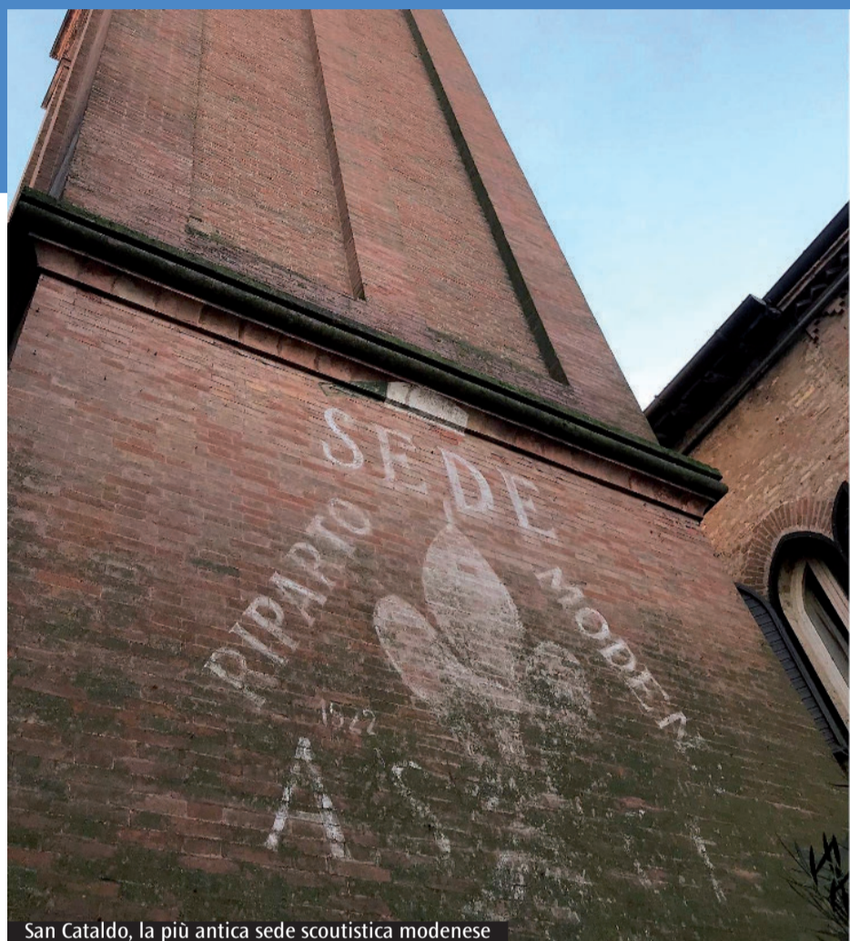
San Cataldo, la più antica sede scoutistica modenese

Entro primavera il lancio sul Web del portale con immagini, interviste, video. Per l'importante anniversario del 2022 è in programma l'apertura dell'esposizione nel santuario della Madonna del Murazzo «Manteniamo vivi i principi dello scoutismo e condividiamoli»