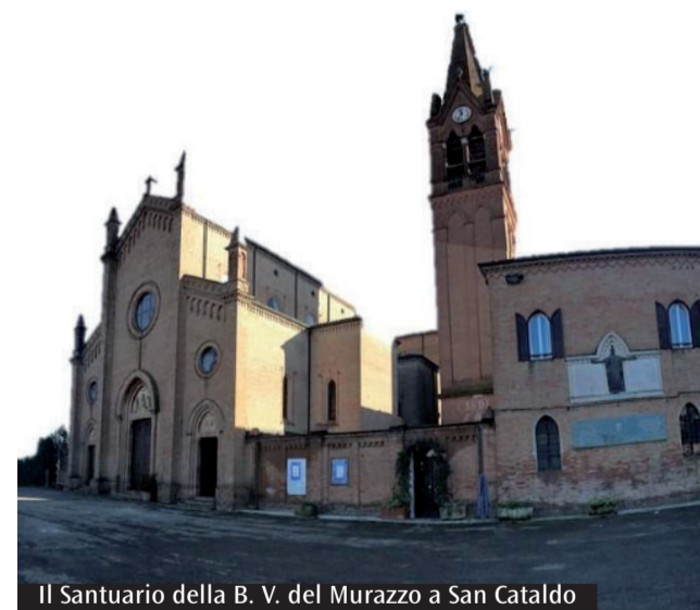
Il Santuario della B. V. del Murazzo a San Cataldo

amministrazione@stilescout.it. Non solo memoria, ma anche attività sul quotidiano. L'associazione «Stilescout oltre 100 anni» si prefigge infatti la possibilità di fare servizio attraverso la rivalutazione di luoghi caratteristici del percorso scout in città, la promozione di eventi artistici e culturali ed iniziative di formazione ed informazione per una cultura della legalità avversa al bullismo e al cameralismo tossico e fondata invece su ideali di solidarietà fraterna. Ultimo passo, ma non meno importante, sarà l'apertura del museo dello scoutismo modenese nel mese di settembre del 2022 presso il santuario della Madonna del Murazzo, già luogo di servizio con Porta Aperta, dove sarà possibile vedere dal vivo i cimeli scout oltre che incontrarsi con questa esperienza. All'interno del museo dello scoutismo modenese si troveranno, esposti in bacheca in un percorso allestito lungo diverse stanze, i documenti, i reperti e le fotografie più segnanati, ma sarà anche possibile incontrare direttamente i membri di «Stilescout», custodi della storia e dei valori di una delle più antiche istituzioni della città che proprio il 10 settembre 2022 festeggerà i suoi cento anni di vita.