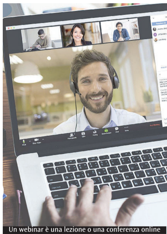
Un webinar è una lezione o una conferenza online