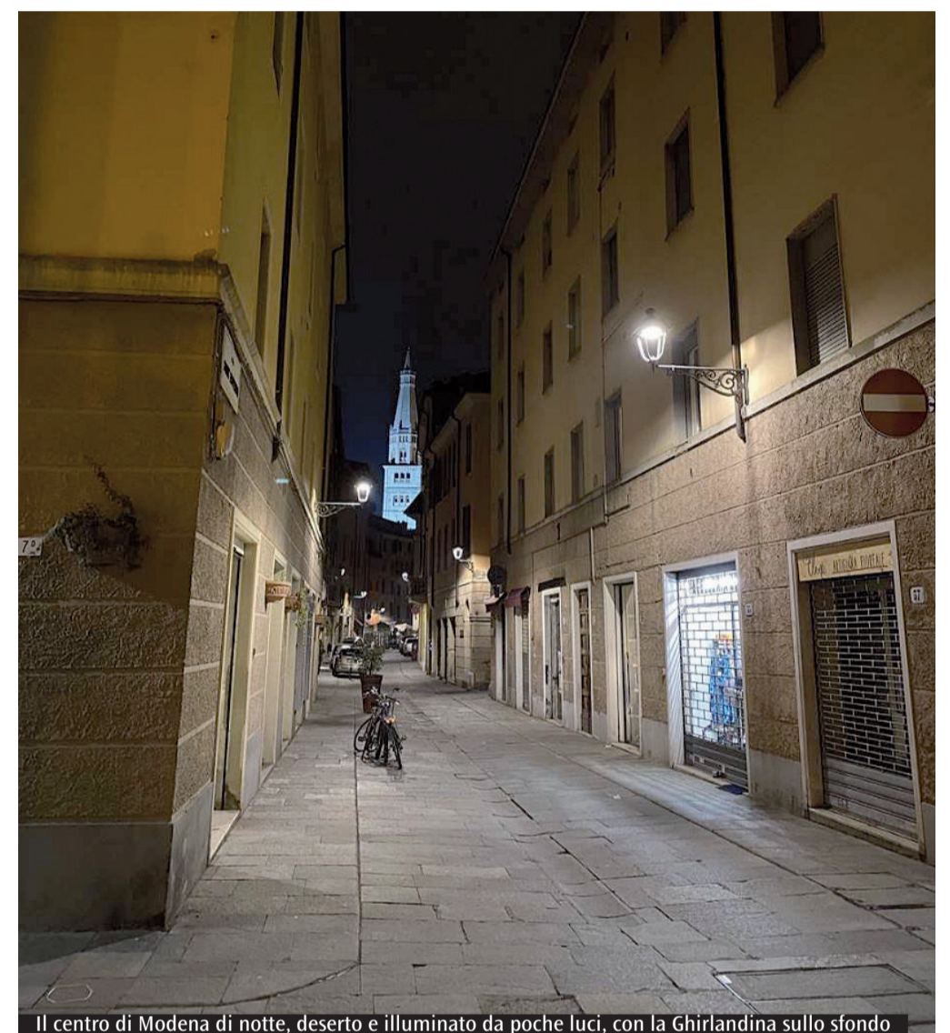
Il centro di Modena di notte, deserto e illuminato da poche luci, con la Ghirlandina sullo sfondo