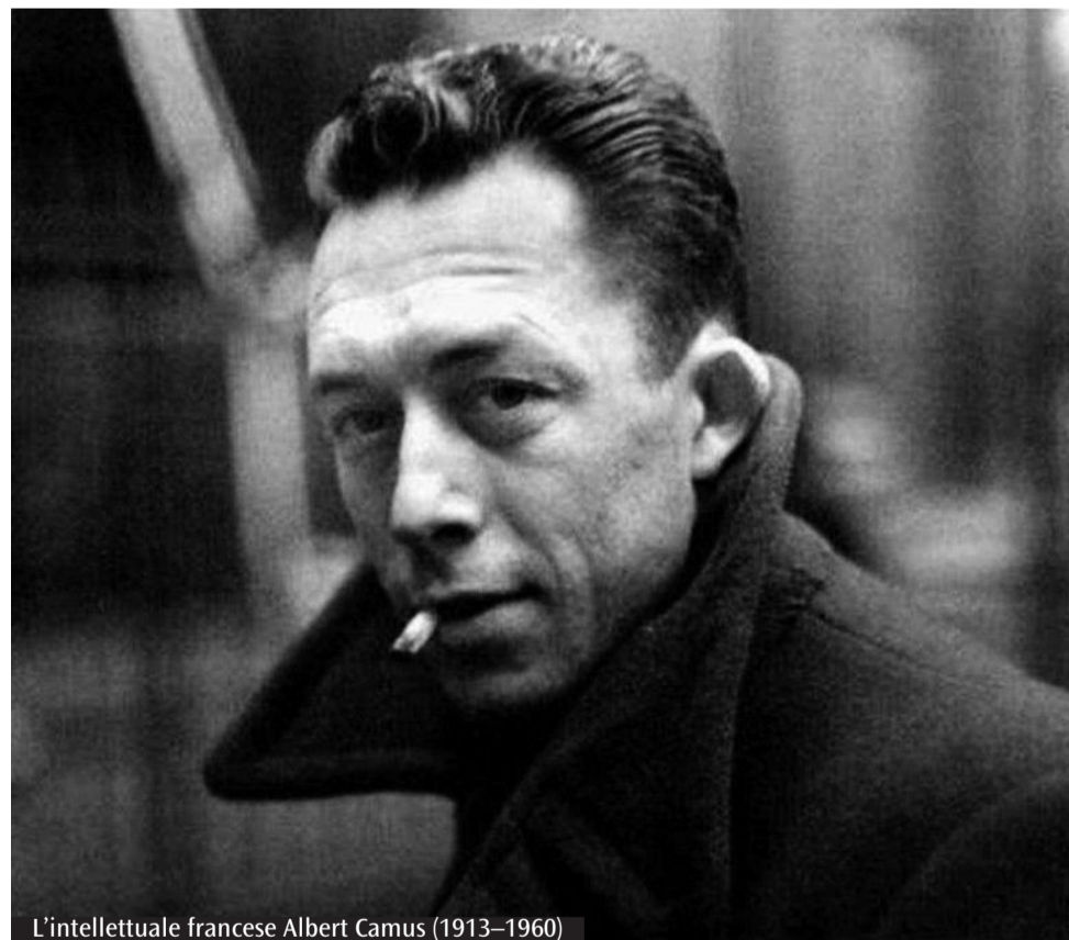
L'intellettuale francese Albert Camus (1913-1960)

«Sono due i temi che emergono da quest'esperienza: il senso della propria vulnerabilità e la fine dell'illusione di poter bastare a se stessi»