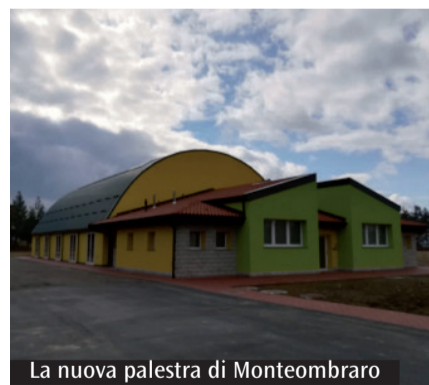
La nuova palestra di Monteombraro

Aiuterà l'istituto agrario Spallanzani ed è nata grazie alla fondazione Bianchi-San Carlo, che ora interverrà sull'ex collegio