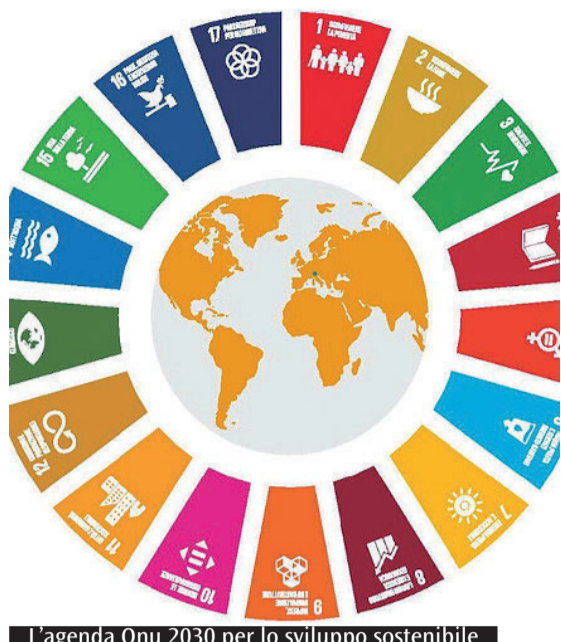
L'agenda Onu 2030 per lo sviluppo sostenibile