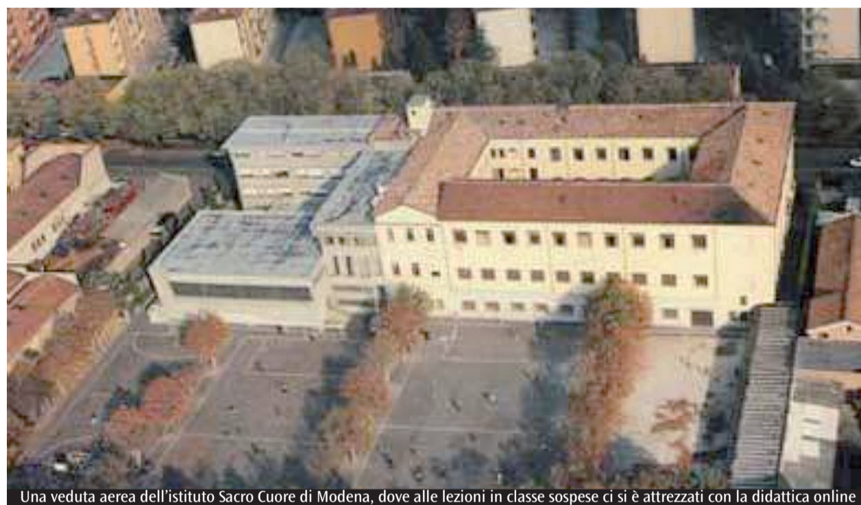
Una veduta aerea dell'istituto Sacro Cuore di Modena, dove alle lezioni in classe sospese ci si è attrezzati con la didattica online

Come si possono aiutare? Abbiamo pensato che dare un po' di ordinarietà al lavoro seppur da casa potesse essere un segnale di attenzione e di vicinanza. In particolare per una scuola cattolica come la nostra è rilevante non abbandonare i ragazzi e le famiglie in questo momento di emergenza. Perché come ricorda papa Francesco le persone sono fatte di tre dimensioni: mente, mani e cuore. La didattica online è molto utile per lo sviluppo della mente, perché si possono continuare a veicolare tante conoscenze. È abbastanza valida anche per lo sviluppo delle mani, per quella dimensione operativa che tra l'altro è molto rilevante rispetto alle nuove professioni. E poi c'è la dimensione del cuore, della vicinanza, della compagnia. Ci siamo accorti che mandando messaggi frequenti e usando in particolare la videoconferenza, si poteva gestire abbastanza bene la dimensione della relazione, della riflessione, delle tensioni dei ragazzi. La chiusura fino a metà marzo causerà danni al sistema scolastico? La scuola è un'istituzione a servizio della formazione e deve essere concretamente vicina alla persona là dove sono e là come sono. È chiaro che la programmazione didattica, lo sviluppo dei contenuti che si erano immaginati a inizio anno, non può essere la stessa. Ma per una cosa che per noi non sono altre che acquisiti. Penso in particolare a una modalità di maggiore responsabilizzazione dei ragazzi che devono scegliere di lavorare in modo autonomo dalla scrivania di casa.