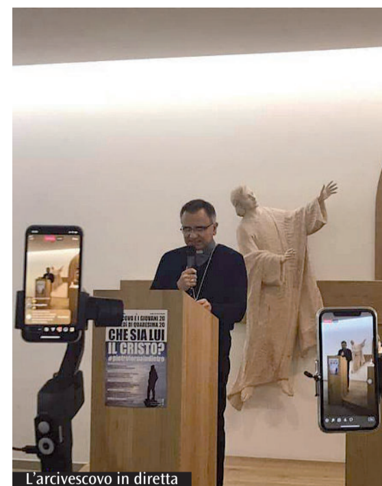
L'arcivescovo in diretta

Cristo ha preso le distanze, presentare le epidemie come castighi divini è contrario al Vangelo. Altri attendono il messia guaritore: è giusto domandare la guarigione con la preghiera ma non possiamo pretenderla. Ignorare le prescrizioni delle autorità non è affidarsi alla provvidenza ma sfidarla, la prima azione della provvidenza è quella di averci dato un cervello». Il virus diventa invece un'occasione per combattere una malattia ancora più profonda, quella dell'egoismo. «La rinuncia alla celebrazione eucaristica ci fa condividere la condizione di tante persone inferme o di comunità perseguitate e ci rende ancora più consapevoli della bellezza di questo dono. Rendiamo virale la solidarietà».