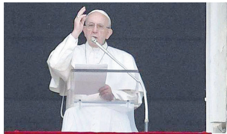
Papa Francesco nell'Angelus domenicale dalla finestra degli appartamenti papali