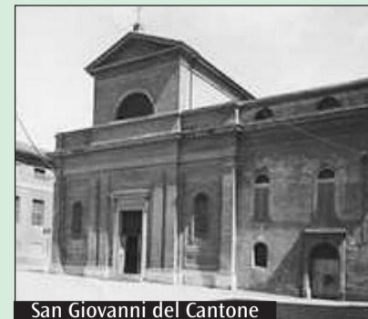
San Giovanni del Cantone

Le Carmelitane vissero per un secolo, dal 1859 al 1959, nella chiesa dell'Immacolata in San Giovanni del Cantone, vicino a Corso Canalgrande. L'edificio, sorto come commenda dei Cavalieri di Malta nel XIII secolo, sul luogo che aveva ospitato una antica magione templare, fu dal XVII al XVIII secolo la parrocchia di corte della quale dipendevano le cappelle del Palazzo Ducale. Soppressa dopo il riordino delle parrocchie cittadine voluto dal governo estense, cadde lungamente in abbandono. Nel 1855, alcune dame modenesi lanciarono un appello perché fosse costruita una cappella espiatoria contro la devastante epidemia di colera, che stava causando